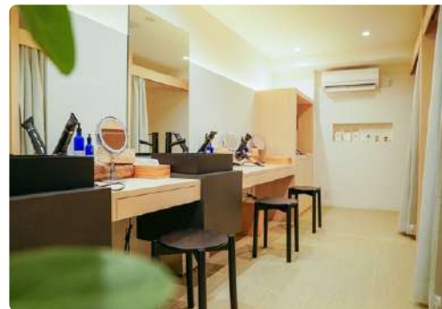
女性専用リラックスエリア