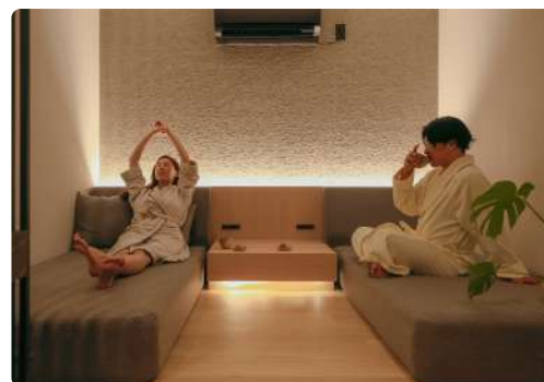
男性やカップルでの入浴が可能