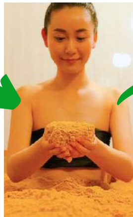
えん発酵温熱木浴