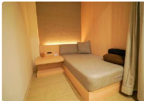
半個室リラックスROOM