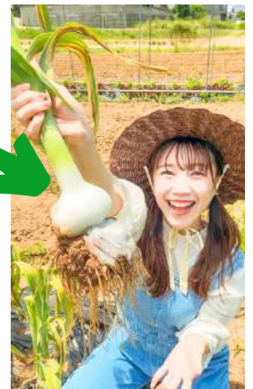
オーガニック野菜へ

えんでは、山地を変えていくこと、美しい土壌を作っていくこともミッションにしています。