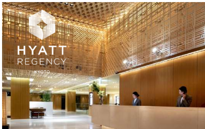
ハイアット リージェンシー京都